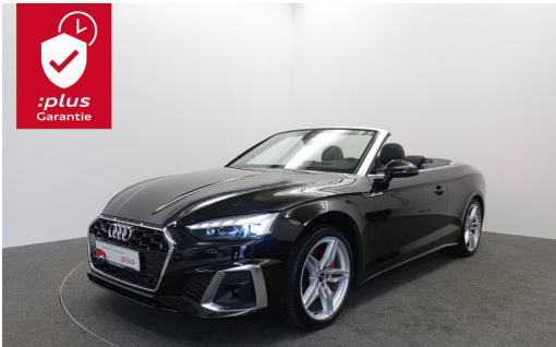
Bierschneider Audi Gebrauchtwagen plus