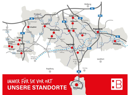
IMMER FÜR SIE VOR ORT UNSERE STANDORTE