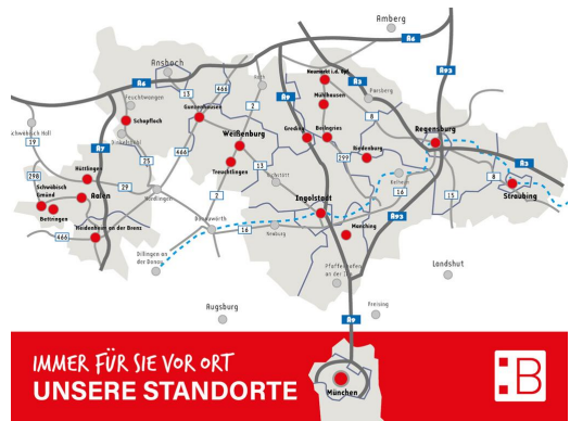
IMMER FÜR SIE VOR ORT UNSERE STANDORTE