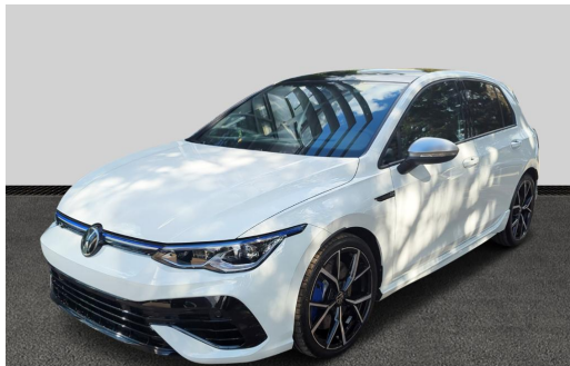
Volkswagen Zentrum Freiburg Autohaus Gehlert GmbH & Co.KG