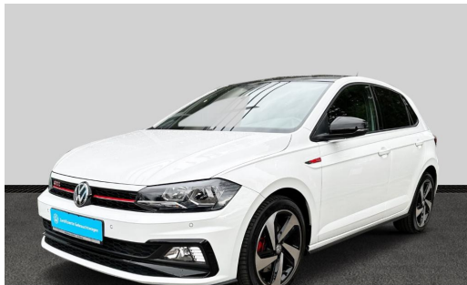
Volkswagen Zentrum Freiburg Autohaus Gehlert GmbH & Co.KG