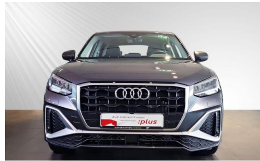
Audi Zentrum Kiel schmidt&hoffmann mobilität Audi Gebrauchtwagen :plus