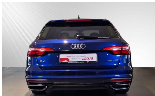
Audi Zentrum Kiel schmidt&hoffmann mobilität Audi Gebrauchtwagen :plus