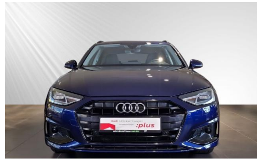
Audi Zentrum Kiel schmidt&hoffmann mobilität Audi Gebrauchtwagen :plus