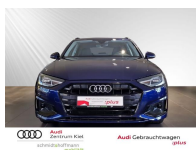
Audi Gebrauchtwagen :plus