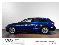
Audi Gebrauchtwagen :plus