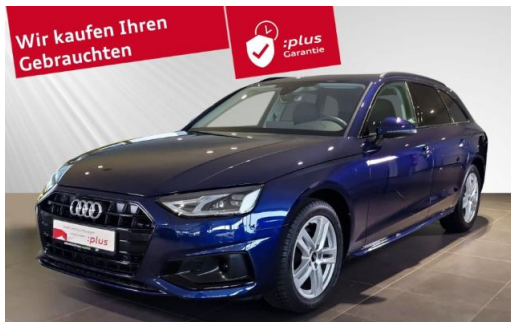
Audi Zentrum Kiel schmidt&hoffmann mobilität Audi Gebrauchtwagen :plus