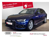
Audi Gebrauchtwagen :plus