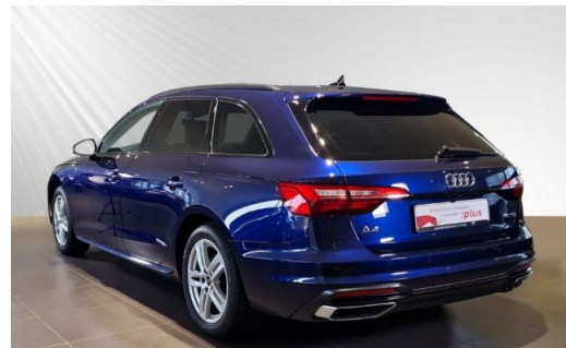
Audi Zentrum Kiel schmidt&hoffmann mobilität Audi Gebrauchtwagen :plus