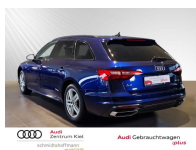
Audi Gebrauchtwagen :plus