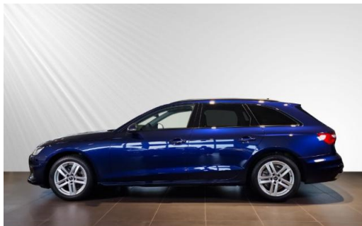
Audi Zentrum Kiel schmidt&hoffmann mobilität Audi Gebrauchtwagen :plus