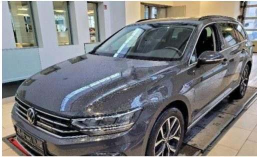
Volkswagen Zentrum Kiel schmidt&hoffmann mobilität