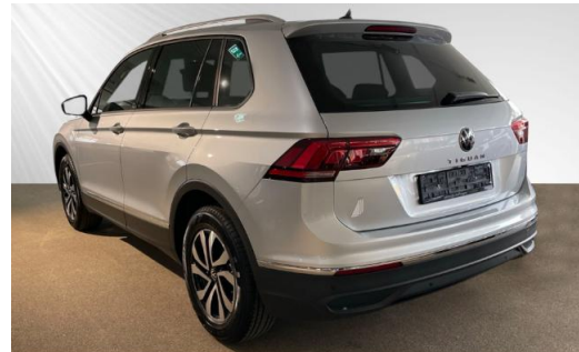
Volkswagen Zentrum Kiel schmidt&hoffmann mobilität