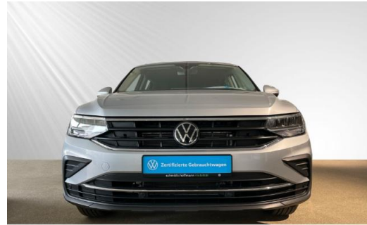
Volkswagen Zentrum Kiel schmidt&hoffmann mobilität