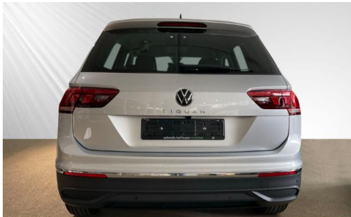
Volkswagen Zentrum Kiel schmidt&hoffmann mobilität