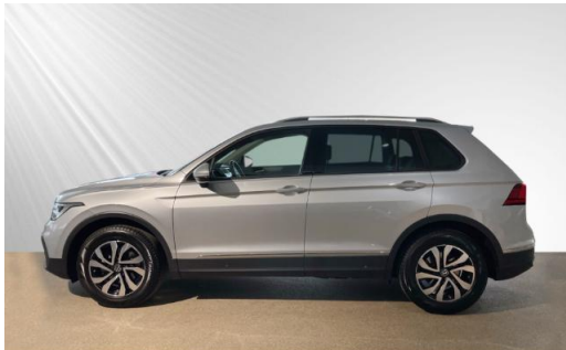
Volkswagen Zentrum Kiel schmidt&hoffmann mobilität