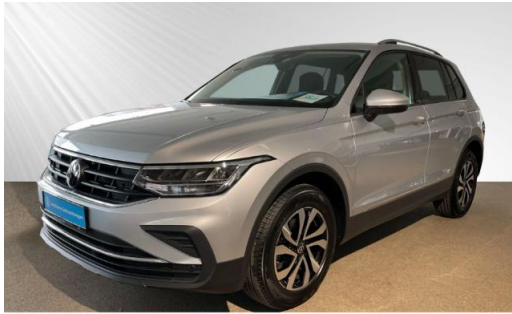
Volkswagen Zentrum Kiel schmidt&hoffmann mobilität