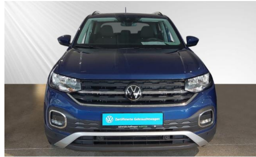
Volkswagen Zentrum Kiel schmidt&hoffmann mobilität