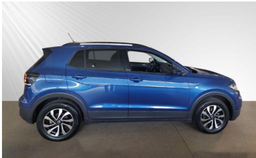
Volkswagen Zentrum Kiel schmidt&hoffmann mobilität