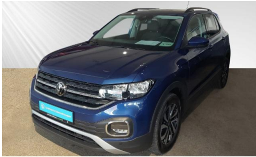
Volkswagen Zentrum Kiel schmidt&hoffmann mobilität