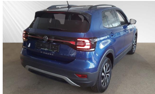
Volkswagen Zentrum Kiel schmidt&hoffmann mobilität