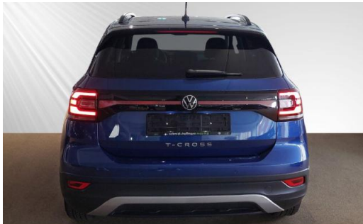
Volkswagen Zentrum Kiel schmidt&hoffmann mobilität