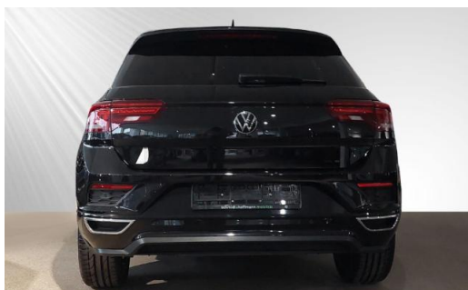
Volkswagen Zentrum Kiel schmidt&hoffmann mobilität