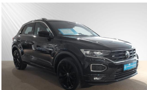
Volkswagen Zentrum Kiel schmidt&hoffmann mobilität