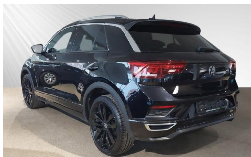
Volkswagen Zentrum Kiel schmidt&hoffmann mobilität