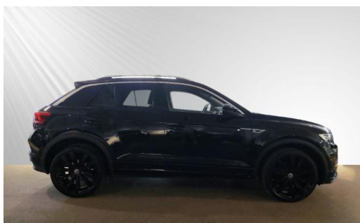
Volkswagen Zentrum Kiel schmidt&hoffmann mobilität