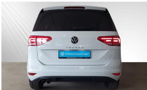
Volkswagen Zentrum Kiel schmidt&hoffmann mobilität