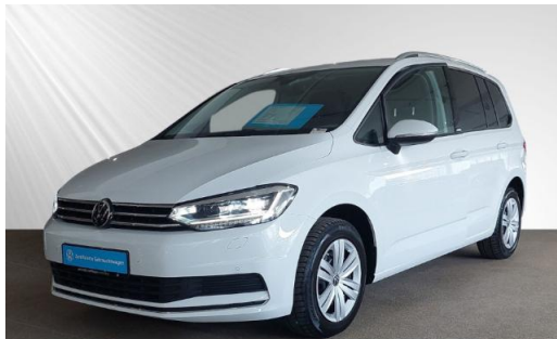
Volkswagen Zentrum Kiel schmidt&hoffmann mobilität