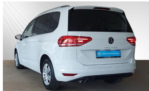
Volkswagen Zentrum Kiel schmidt&hoffmann mobilität