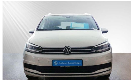
Volkswagen Zentrum Kiel schmidt&hoffmann mobilität