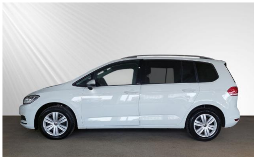
Volkswagen Zentrum Kiel schmidt&hoffmann mobilität