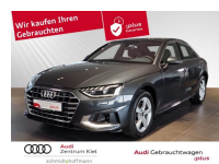
Audi Gebrauchtwagen :plus