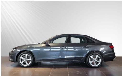
Audi Zentrum Kiel Audi Gebrauchtwagen :plus schmidt&hoffmann mobilität