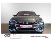
Audi Gebrauchtwagen :plus