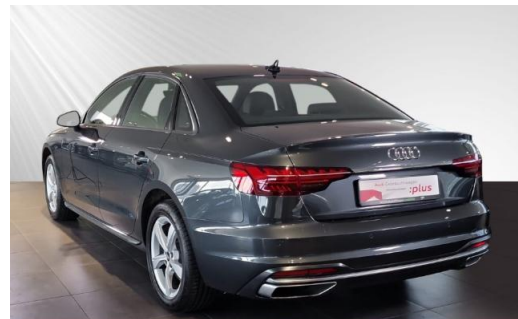
Audi Zentrum Kiel Audi Gebrauchtwagen :plus schmidt&hoffmann mobilität