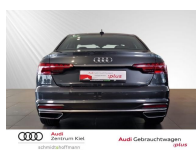
Audi Gebrauchtwagen :plus