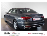
Audi Gebrauchtwagen :plus