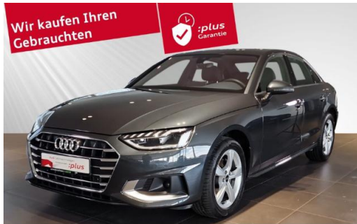
Audi Zentrum Kiel Audi Gebrauchtwagen :plus schmidt&hoffmann mobilität