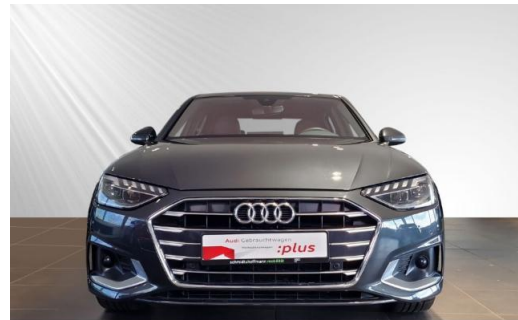
Audi Zentrum Kiel Audi Gebrauchtwagen :plus schmidt&hoffmann mobilität