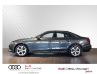
Audi Gebrauchtwagen :plus