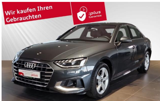
Audi Zentrum Kiel schmidt&hoffmann mobilität