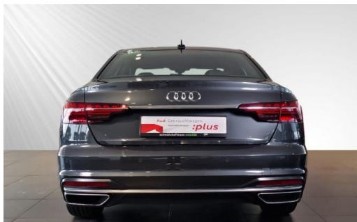
Audi Zentrum Kiel schmidt&hoffmann mobilität