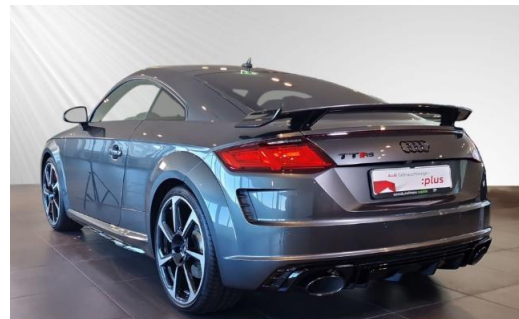
Audi Zentrum Kiel schmidt&hoffmann mobilität Audi Gebrauchtwagen :plus