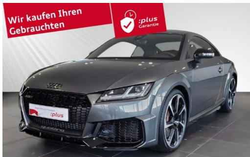
Audi Zentrum Kiel schmidt&hoffmann mobilität Audi Gebrauchtwagen :plus