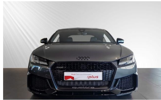
Audi Zentrum Kiel schmidt&hoffmann mobilität Audi Gebrauchtwagen :plus