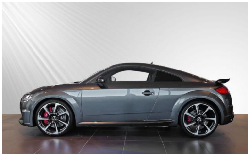
Audi Zentrum Kiel schmidt&hoffmann mobilität Audi Gebrauchtwagen :plus