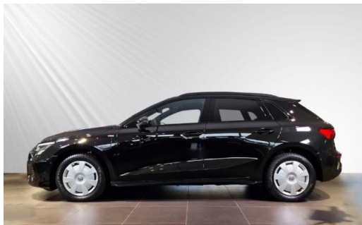
Audi Zentrum Kiel Audi Gebrauchtwagen plus schmidt&hoffmann mobilität