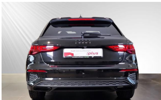
Audi Zentrum Kiel Audi Gebrauchtwagen plus schmidt&hoffmann mobilität