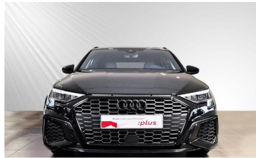
Audi Zentrum Kiel Audi Gebrauchtwagen plus schmidt&hoffmann mobilität