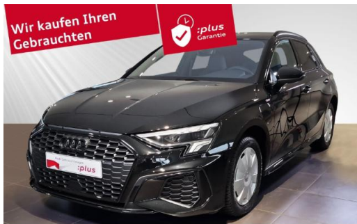
Audi Zentrum Kiel Audi Gebrauchtwagen plus schmidt&hoffmann mobilität