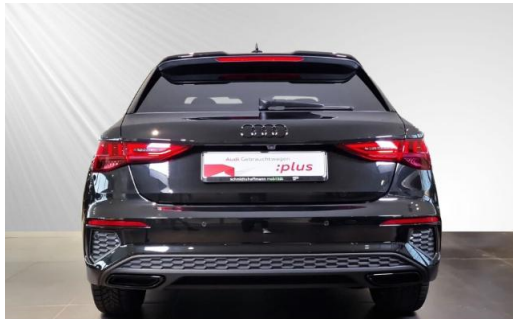
Audi Zentrum Kiel schmidt&hoffmann mobilität Audi Gebrauchtwagen :plus