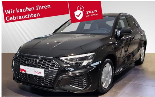
Audi Zentrum Kiel schmidt&hoffmann mobilität Audi Gebrauchtwagen :plus