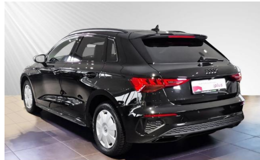
Audi Zentrum Kiel schmidt&hoffmann mobilität Audi Gebrauchtwagen :plus