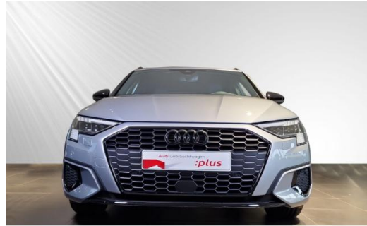
Audi Zentrum Kiel Audi Gebrauchtwagen :plus schmidt&hoffmann mobilität