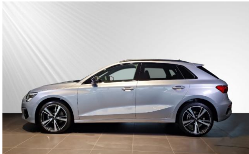
Audi Zentrum Kiel Audi Gebrauchtwagen :plus schmidt&hoffmann mobilität