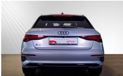
Audi Zentrum Kiel Audi Gebrauchtwagen :plus schmidt&hoffmann mobilität