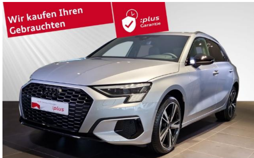
Audi Zentrum Kiel Audi Gebrauchtwagen :plus schmidt&hoffmann mobilität