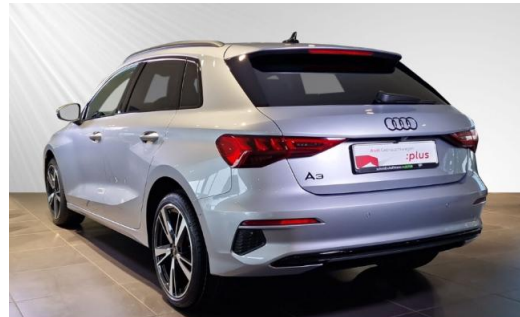
Audi Zentrum Kiel Audi Gebrauchtwagen :plus schmidt&hoffmann mobilität