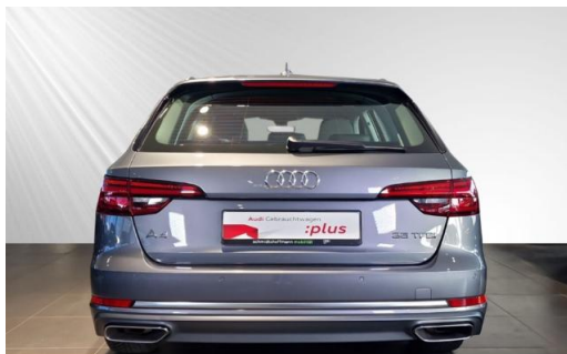
Audi Zentrum Kiel Audi Gebrauchtwagen :plus schmidt&hoffmann mobilität