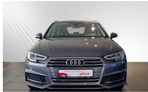
Audi Zentrum Kiel Audi Gebrauchtwagen :plus schmidt&hoffmann mobilität