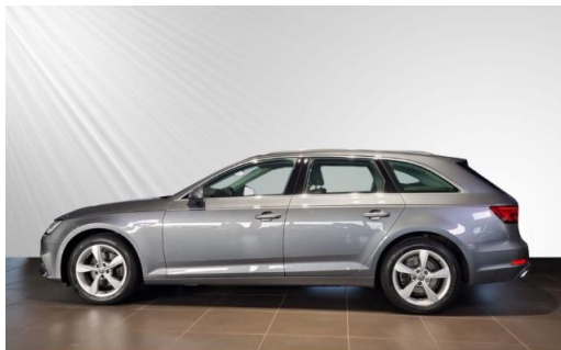
Audi Zentrum Kiel Audi Gebrauchtwagen :plus schmidt&hoffmann mobilität