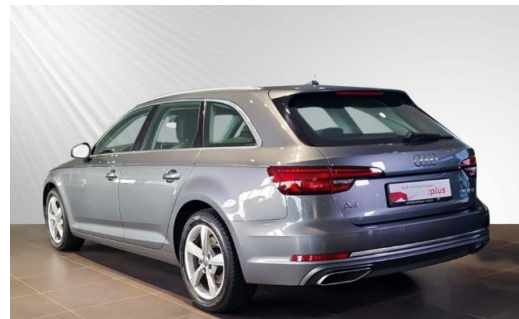
Audi Zentrum Kiel Audi Gebrauchtwagen :plus schmidt&hoffmann mobilität