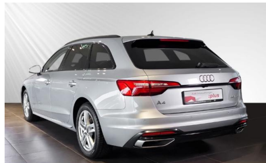
Audi Zentrum Kiel schmidt&hoffmann mobilität Audi Gebrauchtwagen :plus