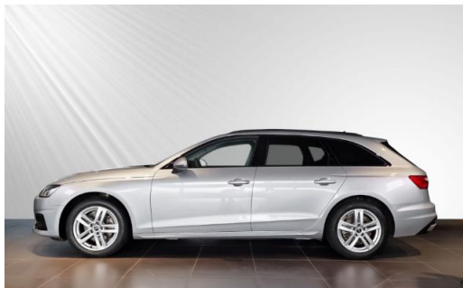
Audi Zentrum Kiel schmidt&hoffmann mobilität Audi Gebrauchtwagen :plus