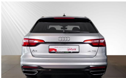
Audi Zentrum Kiel schmidt&hoffmann mobilität Audi Gebrauchtwagen :plus