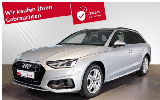
Audi Zentrum Kiel schmidt&hoffmann mobilität Audi Gebrauchtwagen :plus