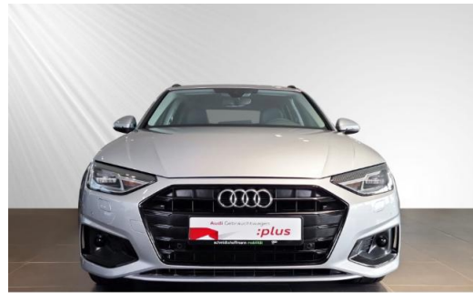
Audi Zentrum Kiel schmidt&hoffmann mobilität Audi Gebrauchtwagen :plus