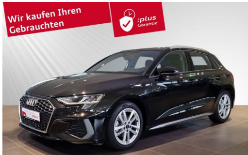
Audi Zentrum Kiel Audi Gebrauchtwagen :plus schmidt&hoffmann mobilität