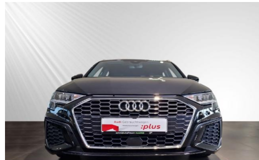
Audi Zentrum Kiel Audi Gebrauchtwagen :plus schmidt&hoffmann mobilität