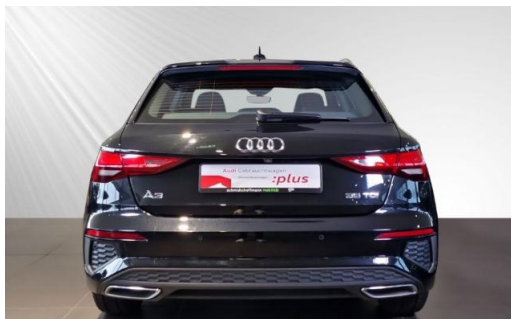
Audi Zentrum Kiel Audi Gebrauchtwagen :plus schmidt&hoffmann mobilität