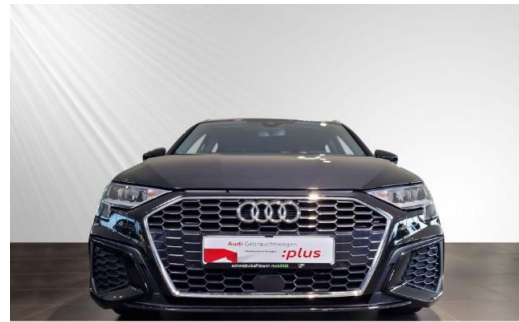
Audi Zentrum Kiel Audi Gebrauchtwagen :plus schmidt&hoffmann mobilität