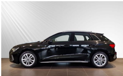
Audi Zentrum Kiel Audi Gebrauchtwagen :plus schmidt&hoffmann mobilität