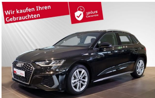
Audi Zentrum Kiel Audi Gebrauchtwagen :plus schmidt&hoffmann mobilität