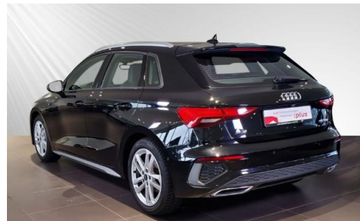
Audi Zentrum Kiel Audi Gebrauchtwagen :plus schmidt&hoffmann mobilität