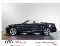
Audi Zentrum Kiel Audi Gebrauchtwagen :plus