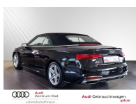
Audi Zentrum Kiel Audi Gebrauchtwagen :plus