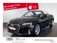
Audi Zentrum Kiel Audi Gebrauchtwagen :plus