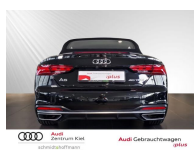
Audi Zentrum Kiel Audi Gebrauchtwagen :plus