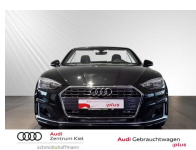
Audi Zentrum Kiel Audi Gebrauchtwagen :plus