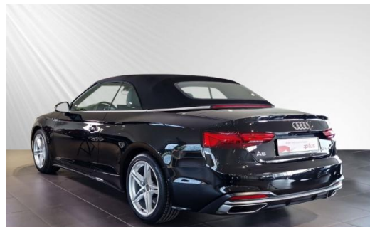
Audi Zentrum Kiel schmidt&hoffmann mobilität