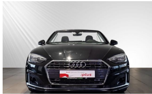
Audi Zentrum Kiel schmidt&hoffmann mobilität