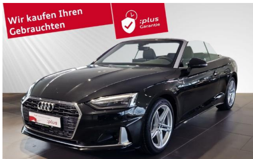
Audi Zentrum Kiel schmidt&hoffmann mobilität