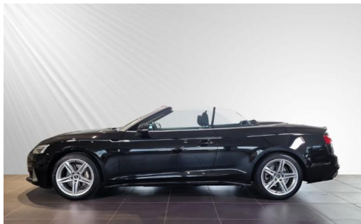
Audi Zentrum Kiel schmidt&hoffmann mobilität