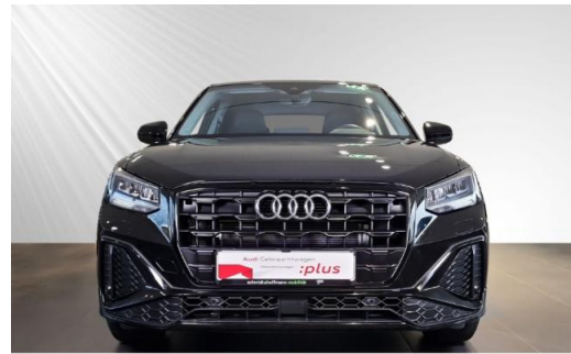
Audi Zentrum Kiel Audi Gebrauchtwagen plus schmidt&hoffmann mobilität