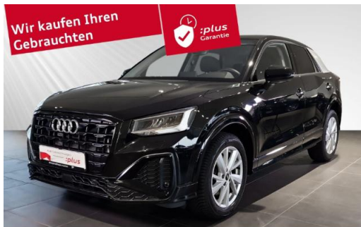
Audi Zentrum Kiel Audi Gebrauchtwagen plus schmidt&hoffmann mobilität