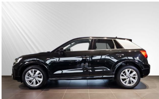
Audi Zentrum Kiel Audi Gebrauchtwagen plus schmidt&hoffmann mobilität