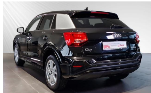
Audi Zentrum Kiel Audi Gebrauchtwagen plus schmidt&hoffmann mobilität