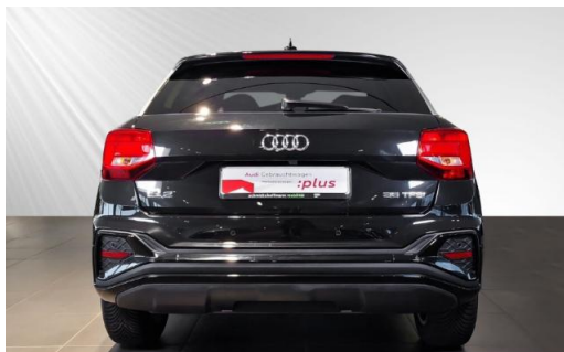
Audi Zentrum Kiel Audi Gebrauchtwagen plus schmidt&hoffmann mobilität