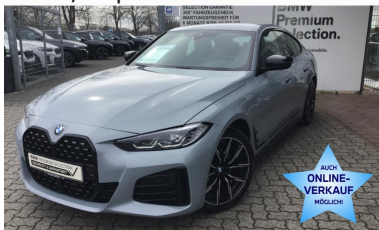
19" H/K SportLenk NUR 8.600Km