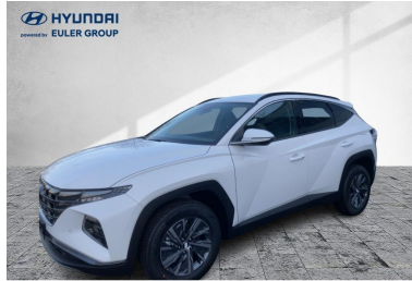
EULER GROUP HYUNDAI