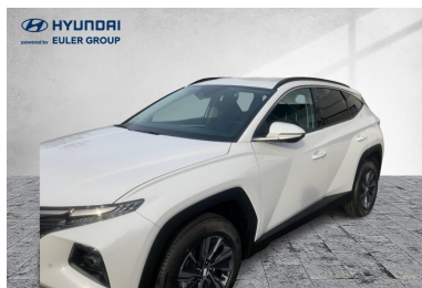
EULER GROUP HYUNDAI