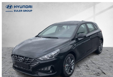
EULER GROUP HYUNDAI