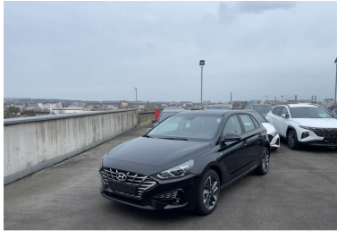
EULER GROUP HYUNDAI