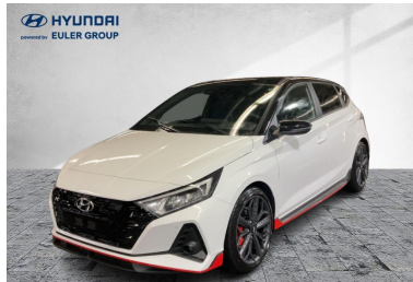
EULER GROUP HYUNDAI