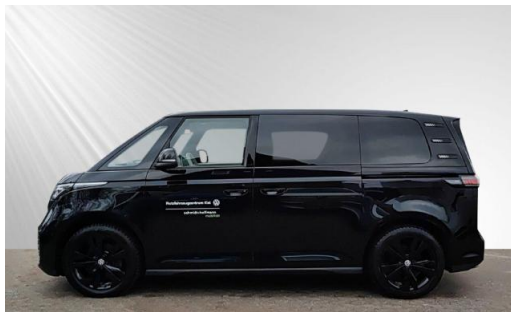
schmidt&hoffmann mobilität ProfiPartner für Gebrauchtwagen Nutzfahrzeuge Zertifizierte Gebrauchtwagen