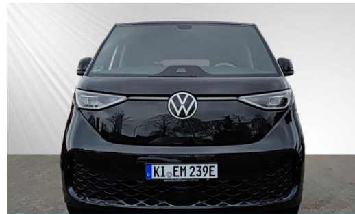
schmidt&hoffmann mobilität ProfiPartner für Gebrauchtwagen Nutzfahrzeuge Zertifizierte Gebrauchtwagen