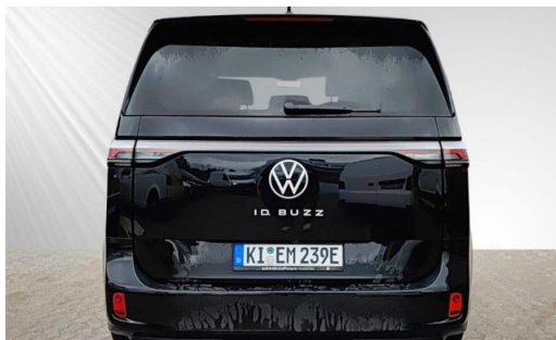
schmidt&hoffmann mobilität ProfiPartner für Gebrauchtwagen Nutzfahrzeuge Zertifizierte Gebrauchtwagen