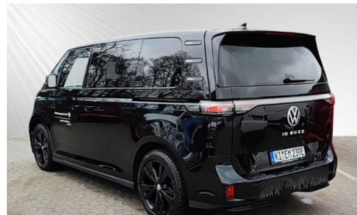
schmidt&hoffmann mobilität ProfiPartner für Gebrauchtwagen Nutzfahrzeuge Zertifizierte Gebrauchtwagen