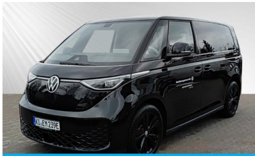
schmidt&hoffmann mobilität ProfiPartner für Gebrauchtwagen Nutzfahrzeuge Zertifizierte Gebrauchtwagen