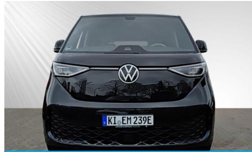
schmidt&hoffmann mobilität ProfiPartner für Gebrauchtwagen Nutzfahrzeuge Zertifizierte Gebrauchtwagen