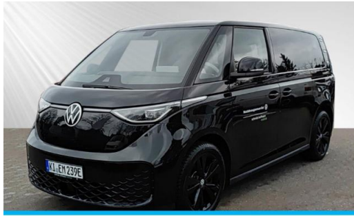
schmidt&hoffmann mobilität ProfiPartner für Gebrauchtwagen Nutzfahrzeuge Zertifizierte Gebrauchtwagen