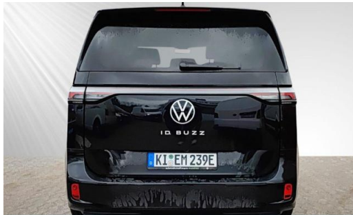
schmidt&hoffmann mobilität ProfiPartner für Gebrauchtwagen Nutzfahrzeuge Zertifizierte Gebrauchtwagen