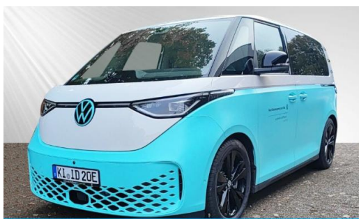
schmidt&hoffmann mobilität ProfiPartner für Gebrauchtwagen Nutzfahrzeuge Zertifizierte Gebrauchtwagen