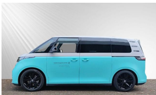
schmidt&hoffmann mobilität ProfiPartner für Gebrauchtwagen Nutzfahrzeuge Zertifizierte Gebrauchtwagen