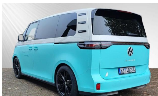
schmidt&hoffmann mobilität ProfiPartner für Gebrauchtwagen Nutzfahrzeuge Zertifizierte Gebrauchtwagen