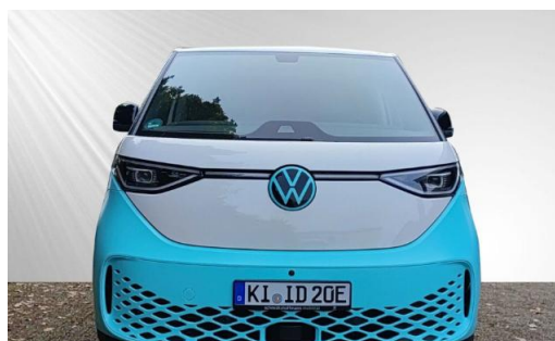
schmidt&hoffmann mobilität ProfiPartner für Gebrauchtwagen Nutzfahrzeuge Zertifizierte Gebrauchtwagen