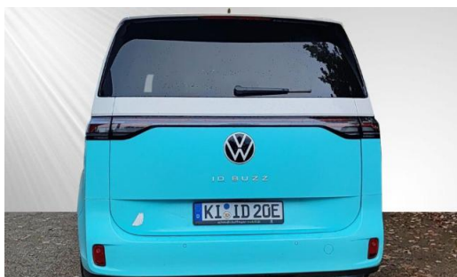
schmidt&hoffmann mobilität ProfiPartner für Gebrauchtwagen Nutzfahrzeuge Zertifizierte Gebrauchtwagen