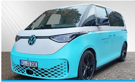
schmidt&hoffmann mobilität ProfiPartner für Gebrauchtwagen Nutzfahrzeuge Zertifizierte Gebrauchtwagen