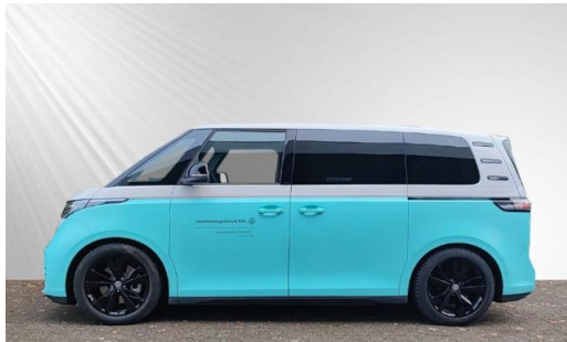
schmidt&hoffmann mobilität ProfiPartner für Gebrauchtwagen Nutzfahrzeuge Zertifizierte Gebrauchtwagen