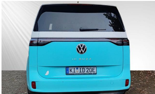
schmidt&hoffmann mobilität ProfiPartner für Gebrauchtwagen Nutzfahrzeuge Zertifizierte Gebrauchtwagen