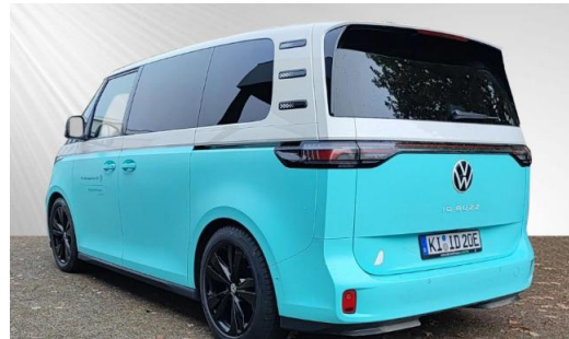
schmidt&hoffmann mobilität ProfiPartner für Gebrauchtwagen Nutzfahrzeuge Zertifizierte Gebrauchtwagen