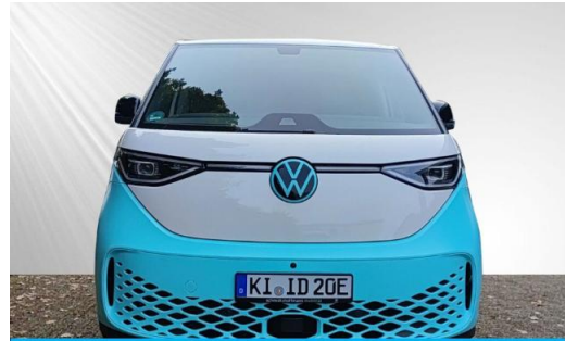
schmidt&hoffmann mobilität ProfiPartner für Gebrauchtwagen Nutzfahrzeuge Zertifizierte Gebrauchtwagen