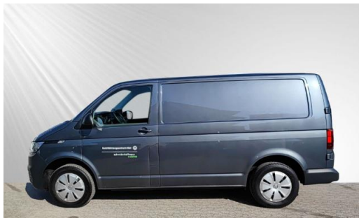
schmidt&hoffmann mobilität | ProfiPartner für Gebrauchtwagen | Zertifizierte Gebrauchtwagen Nutzfahrzeuge