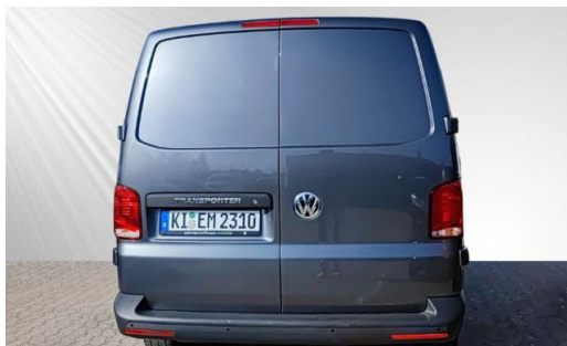
schmidt&hoffmann mobilität | ProfiPartner für Gebrauchtwagen | Zertifizierte Gebrauchtwagen Nutzfahrzeuge