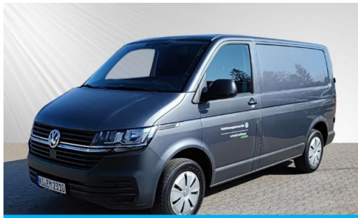
schmidt&hoffmann mobilität | ProfiPartner für Gebrauchtwagen | Zertifizierte Gebrauchtwagen Nutzfahrzeuge