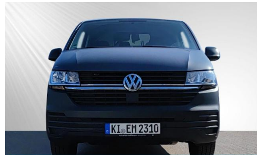
schmidt&hoffmann mobilität | ProfiPartner für Gebrauchtwagen | Zertifizierte Gebrauchtwagen Nutzfahrzeuge