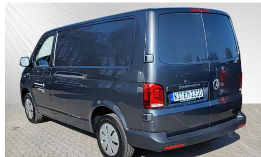
schmidt&hoffmann mobilität | ProfiPartner für Gebrauchtwagen | Zertifizierte Gebrauchtwagen Nutzfahrzeuge