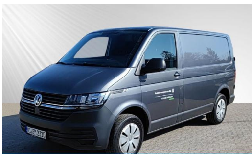
schmidt&hoffmann mobilität | ProfiPartner für Gebrauchtwagen | | Zertifizierte Gebrauchtwagen Nutzfahrzeuge