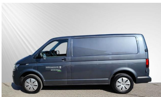
schmidt&hoffmann mobilität | ProfiPartner für Gebrauchtwagen | | Zertifizierte Gebrauchtwagen Nutzfahrzeuge