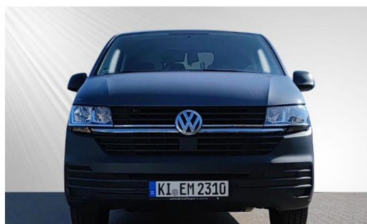
schmidt&hoffmann mobilität | ProfiPartner für Gebrauchtwagen | | Zertifizierte Gebrauchtwagen Nutzfahrzeuge