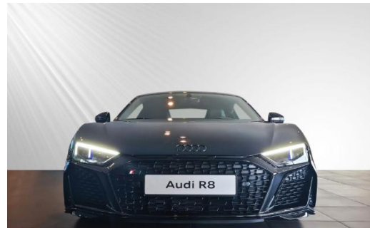
Audi Zentrum Kiel schmidt&hoffmann mobilität