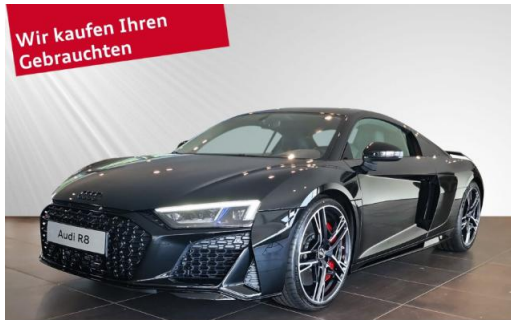
Audi Zentrum Kiel schmidt&hoffmann mobilität