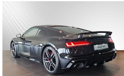
Audi Zentrum Kiel schmidt&hoffmann mobilität