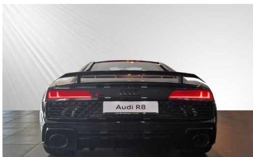
Audi Zentrum Kiel schmidt&hoffmann mobilität