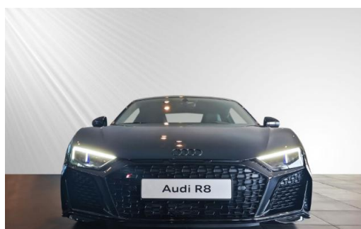
Audi Zentrum Kiel schmidt&hoffmann mobilität