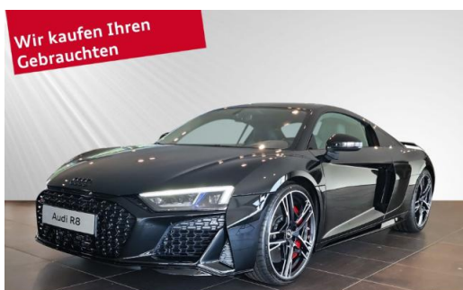
Audi Zentrum Kiel schmidt&hoffmann mobilität