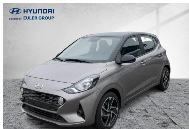
EULER GROUP HYUNDAI