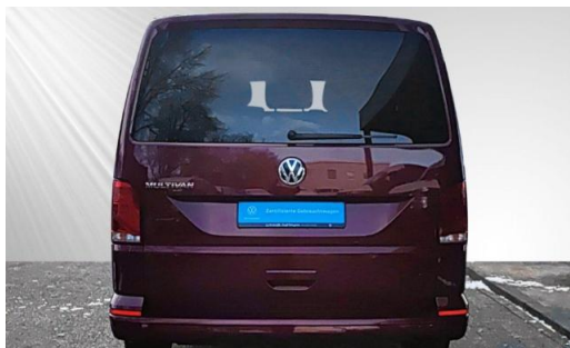
schmidt&hoffmann mobilität | ProfiPartner für Gebrauchtwagen | Zertifizierte Gebrauchtwagen Nutzfahrzeuge