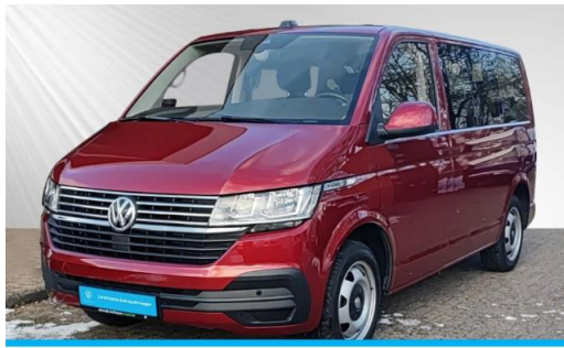
schmidt&hoffmann mobilität ProfiPartner für Gebrauchtwagen Zertifizierte Gebrauchtwagen Nutzfahrzeuge