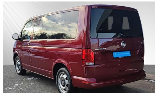
schmidt&hoffmann mobilität ProfiPartner für Gebrauchtwagen Zertifizierte Gebrauchtwagen Nutzfahrzeuge