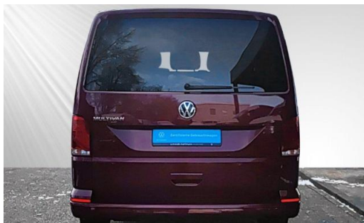
schmidt&hoffmann mobilität ProfiPartner für Gebrauchtwagen Zertifizierte Gebrauchtwagen Nutzfahrzeuge