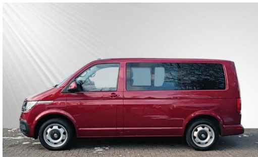
schmidt&hoffmann mobilität ProfiPartner für Gebrauchtwagen Zertifizierte Gebrauchtwagen Nutzfahrzeuge