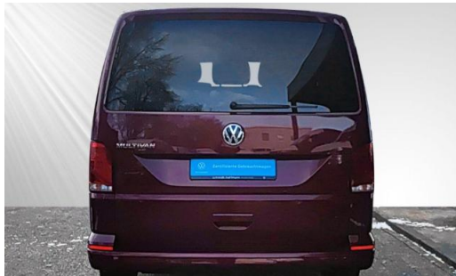
schmidt&hoffmann mobilität ProfiPartner für Gebrauchtwagen Zertifizierte Gebrauchtwagen Nutzfahrzeuge