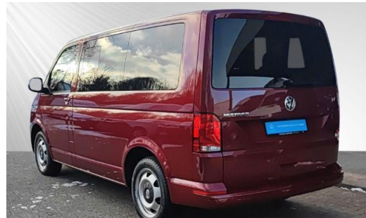
schmidt&hoffmann mobilität ProfiPartner für Gebrauchtwagen Zertifizierte Gebrauchtwagen Nutzfahrzeuge