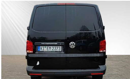
schmidt&hoffmann mobilität | ProfiPartner für Gebrauchtwagen | Zertifizierte Gebrauchtwagen Nutzfahrzeuge