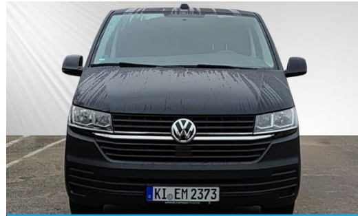
schmidt&hoffmann mobilität | ProfiPartner für Gebrauchtwagen | Zertifizierte Gebrauchtwagen Nutzfahrzeuge