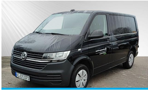
schmidt&hoffmann mobilität | ProfiPartner für Gebrauchtwagen | Zertifizierte Gebrauchtwagen Nutzfahrzeuge