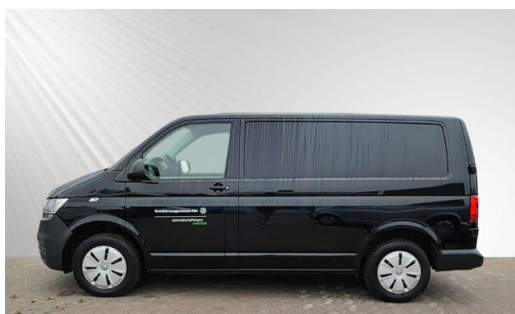
schmidt&hoffmann mobilität ProfiPartner für Gebrauchtwagen Zertifizierte Gebrauchtwagen Nutzfahrzeuge