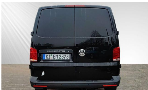
schmidt&hoffmann mobilität ProfiPartner für Gebrauchtwagen Zertifizierte Gebrauchtwagen Nutzfahrzeuge