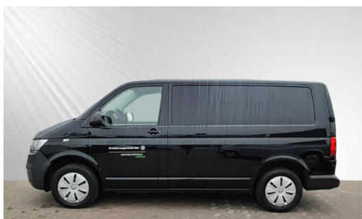
schmidt&hoffmann mobilität ProfiPartner für Gebrauchtwagen Zertifizierte Gebrauchtwagen Nutzfahrzeuge