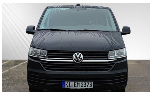
schmidt&hoffmann mobilität ProfiPartner für Gebrauchtwagen Zertifizierte Gebrauchtwagen Nutzfahrzeuge