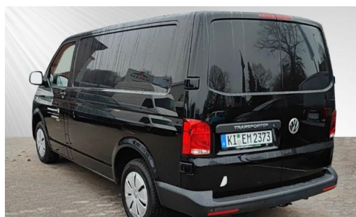
schmidt&hoffmann mobilität ProfiPartner für Gebrauchtwagen Zertifizierte Gebrauchtwagen Nutzfahrzeuge