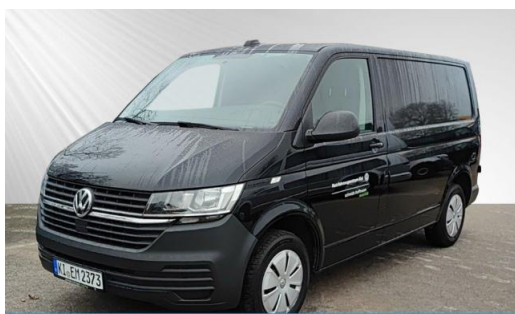
schmidt&hoffmann mobilität ProfiPartner für Gebrauchtwagen Zertifizierte Gebrauchtwagen Nutzfahrzeuge