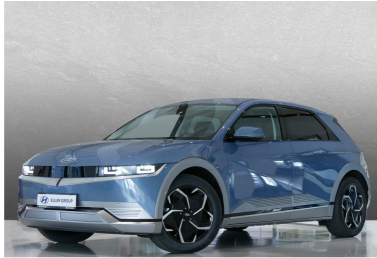
EULER GROUP HYUNDAI