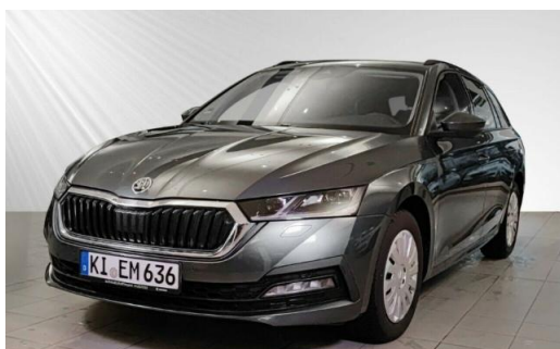
ŠKODA Zentrum Kiel schmidt&hoffmann mobilität