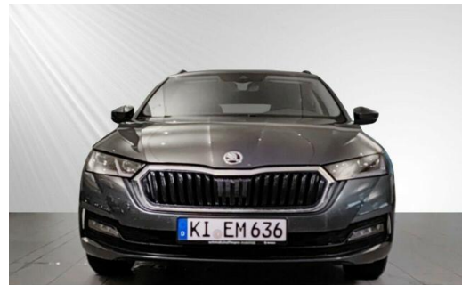
ŠKODA Zentrum Kiel schmidt&hoffmann mobilität